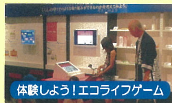
体験しよう！エコライフゲーム