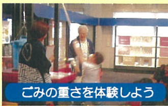
ごみの重さを体験しよう