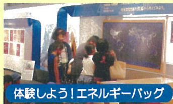
体験しよう！エネルギーバッグ

案内スタッフ<エコサポーター>とコミュニケーションをとりながら、展示を体験します。 子どもたち一人ひとりが、家庭や学校・施設で取り組めるエコライフのヒントを見つけることができます。